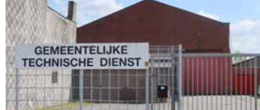
Technische dienst optimaliseren p. 3