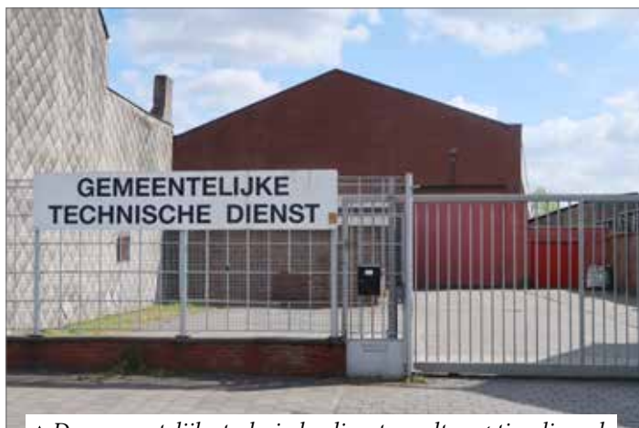
▲ De gemeentelijke technische dienst wordt geoptimaliseerd.