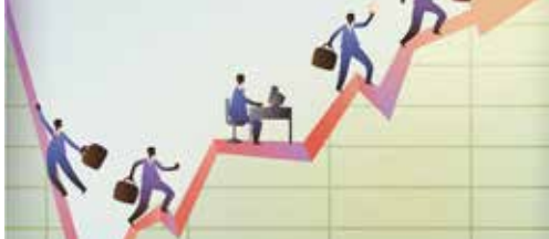
Economisch beleid werpt vruchten af p. 2