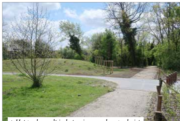
▲ Het park wordt in het najaar verder opgekuist.